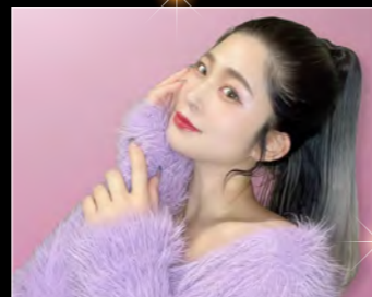
たかまるみずほ TVタレントや配信などマルチに活動するシンガーソングライター