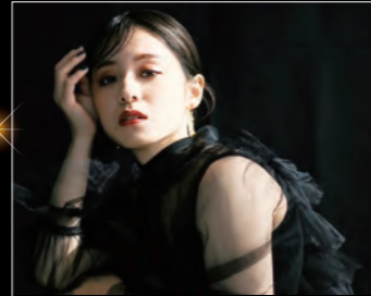
RIKAKO SNS総フォロワー数、約7万人超えの熊本県出身シンガー