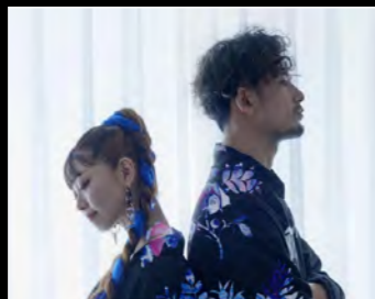
MIOSIC 国内外問わずグローバルな活動を行う男女ボーカルユニット