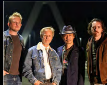
EirFoyl 各国の才能が集結。クロスカルチャーなポップロックバンド