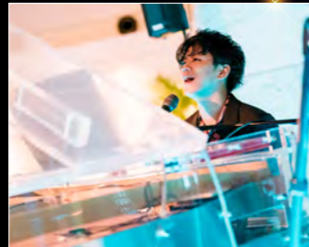
山崎賢一 ソウルフルな歌声が心に浸透する寄り添い系シンガーソングライター