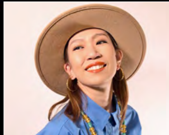
PANG イラストレーターとしても人気を集めるレゲエシンガー。全国で活躍中！